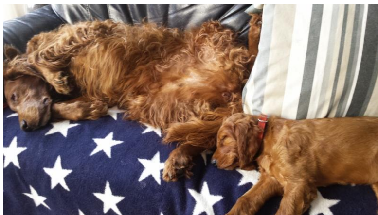
Kaya en Katy